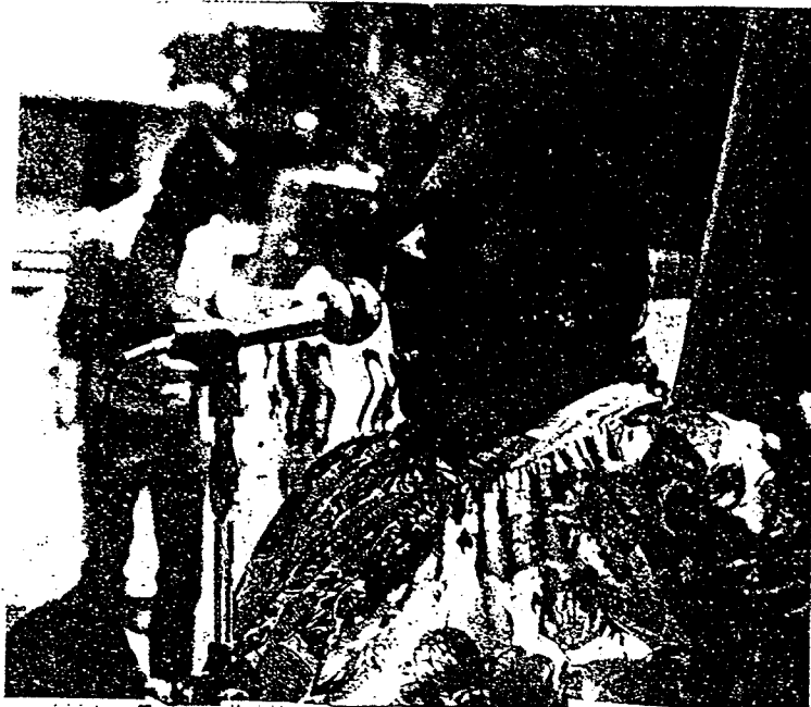
TODO ESTA dichó