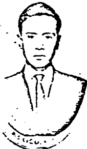
Escuela Primaria de ABRAHAM GONZALEZ MATUTINA CA. Juárez, Chih.